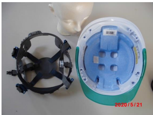
インナーを取り外した状態