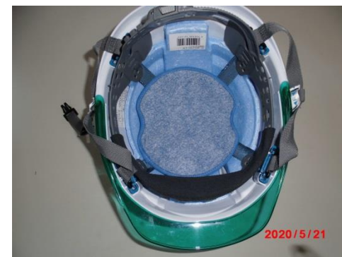
インナー部に貼り付け完成