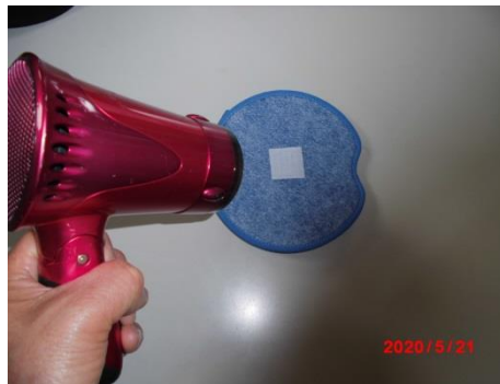
面ファスナー部に熱を掛ける