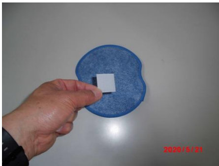
ムレナイン99中央部に面ファスナー貼り付け