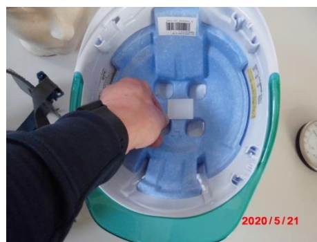
緩衝材中央部に面ファスナーを貼り付ける