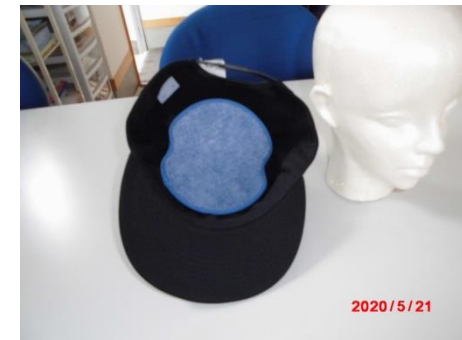
帽子裏面に取り付け完成